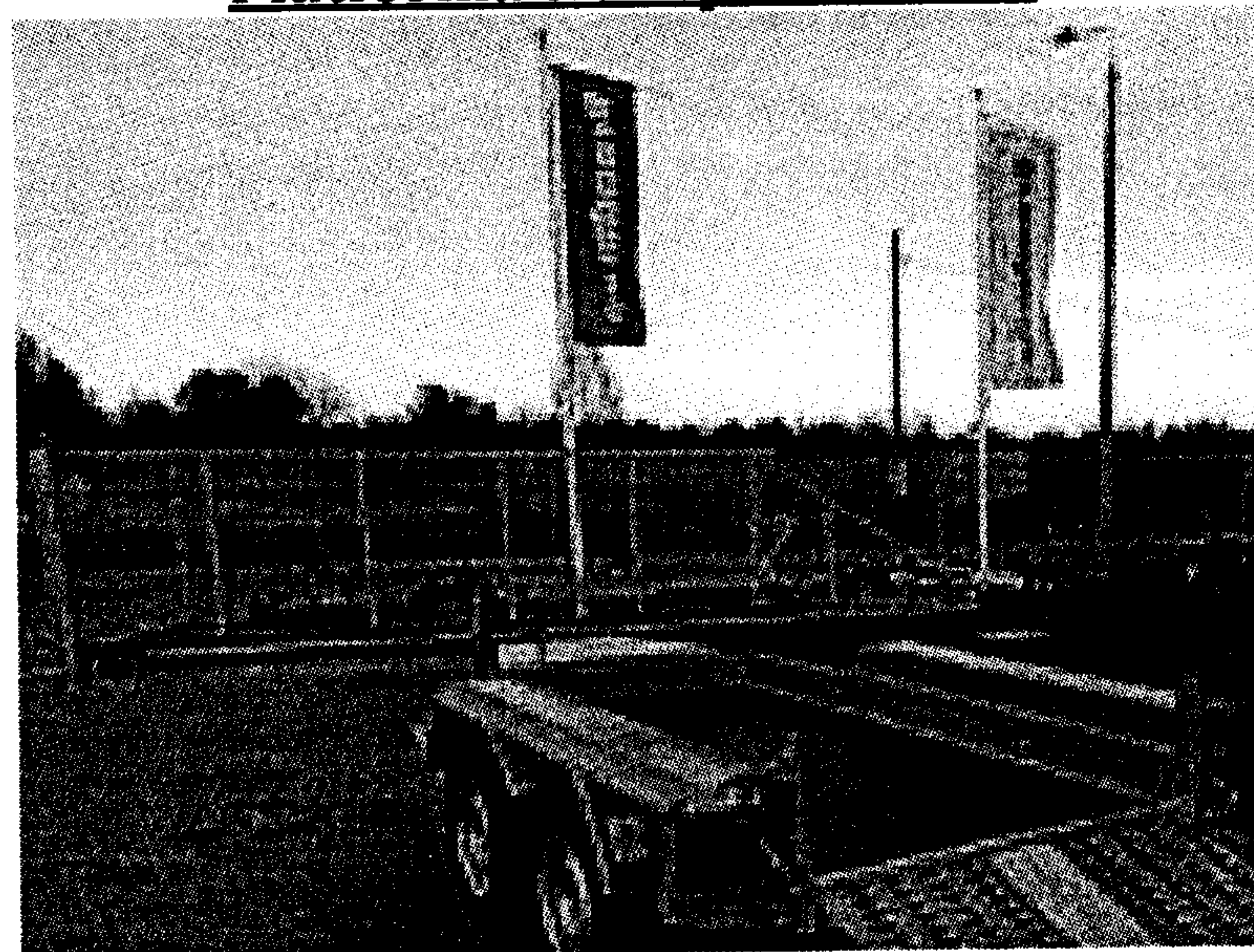
Imaginea este cu caracter informativ